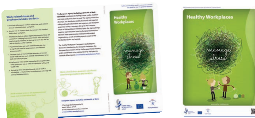
◀ Ejemplo de Campaña informativa. Agencia Europea de Seguridad y Salud en el Trabajo

Asimismo en el anexo 3 se adjunta un modelo breve de presentación a utilizar para la formación/información en factores psicosociales previa al cuestionario.